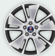
5-spoke 17" (ALU 81) Standaard Aero TX velg (FWD)

Raadpleeg voor de standaarduitrusting en de technische specificaties de Saab 9-3 prijslijst.