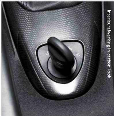
Interieurafwerking in carbon 'look'