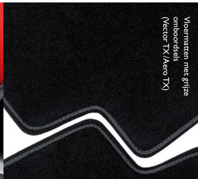
Vloermatten met grijze omboordsels (Vector TX/Aero TX)