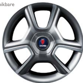
Lichtmetalen velgen 18" (ALU 77) (Aero TX Edition Plus)

Een variant van de Aero TX Edition is de Aero TX Edition Plus met lichtmetalen velgen 18" (ALU 77). De meerprijs van de Aero TX Edition Plus t.o.v. de Aero bedraagt € 900 (incl. BTW).