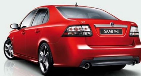
Aero TX Edition Plus