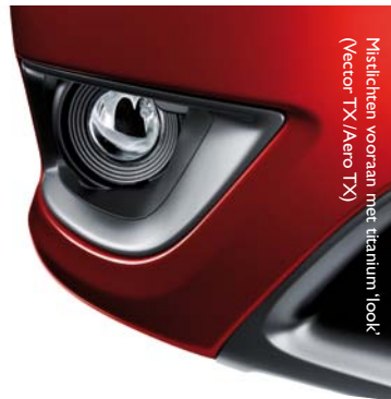
Mistlichten vooraan met titanium 'look' (Vector TX/Aero TX)