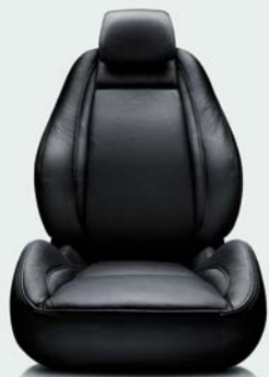
Lederen sportzetels TX – Black (Aero TX)