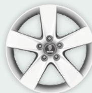
5-spoke 17" (ALU 59) Standaard Vector TX velg