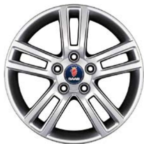
Lichtmetalen velgen 16" (ALU 87) (Linear TX)